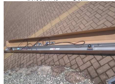
⑤ 新規自動ドア装置取付