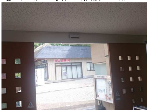
② 自動ドア装置交換中