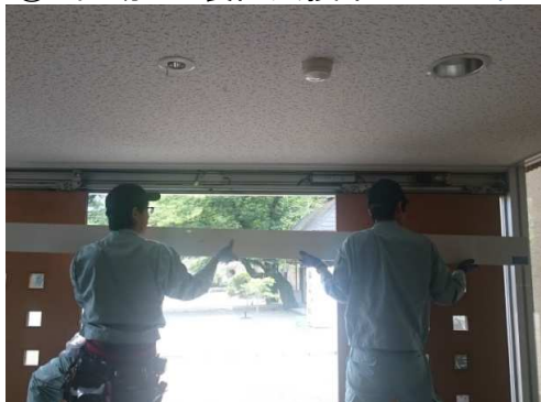
③ 自動ドア装置撤去後