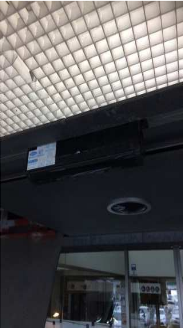
無目下内蔵センサ