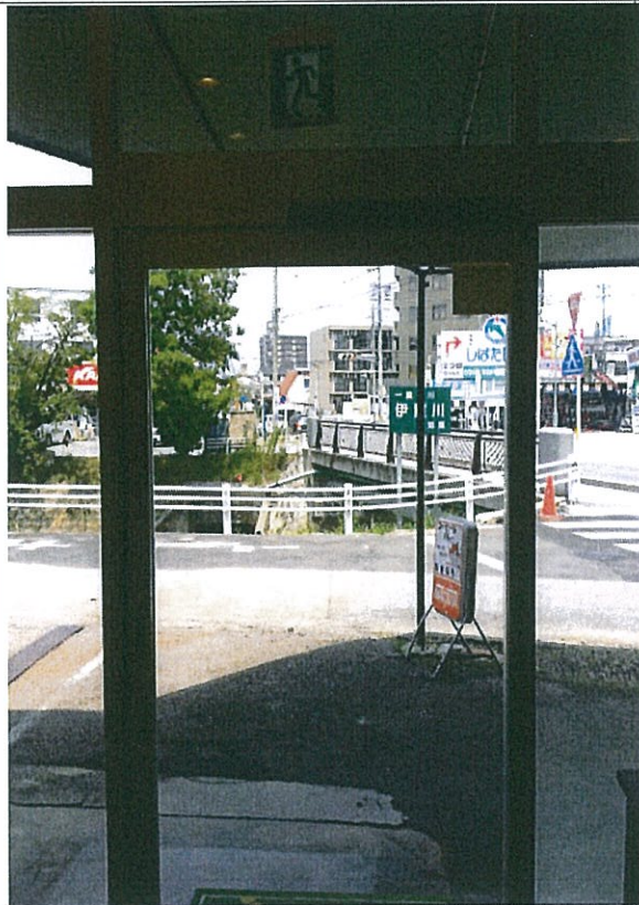
あすなろ 入口写真