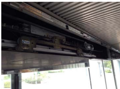
② 老朽化部品撤去中