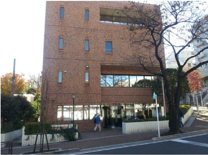
川崎市宮前老人福祉センター 様 神奈川県川崎市宮前区

円形引分け型の自動ドア開閉装置が付いていますが、老朽化して摩耗劣化が進んでいました。振興会は自動ドア開閉装置を寄贈して老朽摩耗劣化による不調の心配を無くしました。