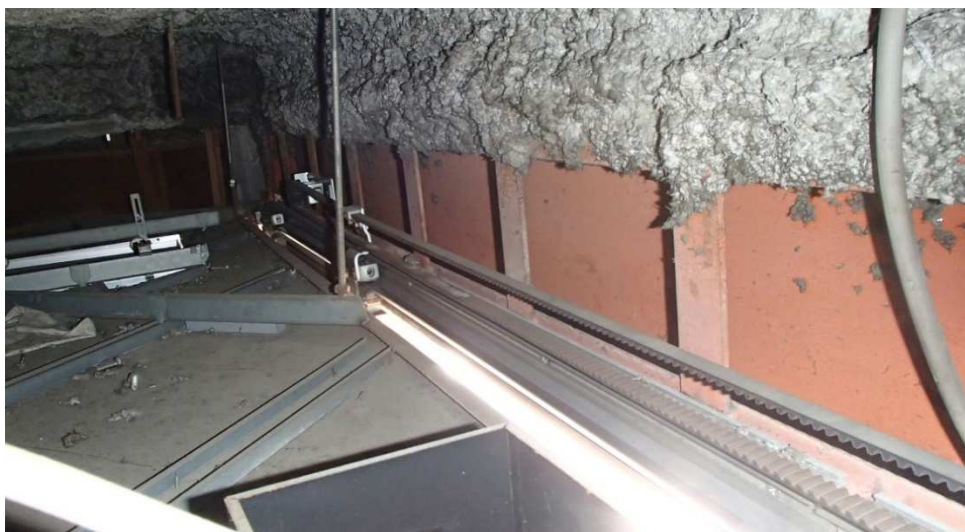
自動ドア開閉装置の様子