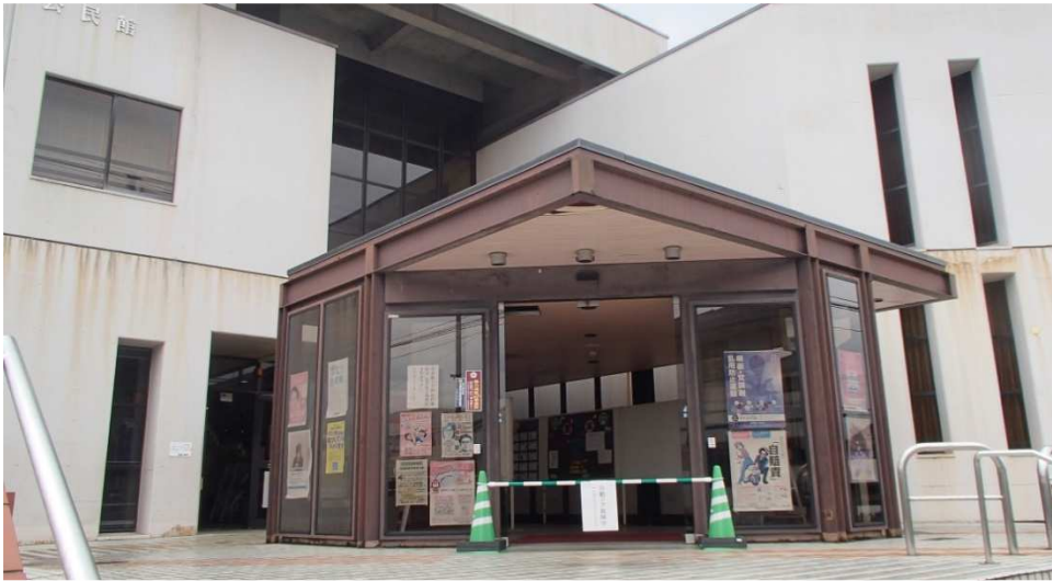
自動ドアフロント外観